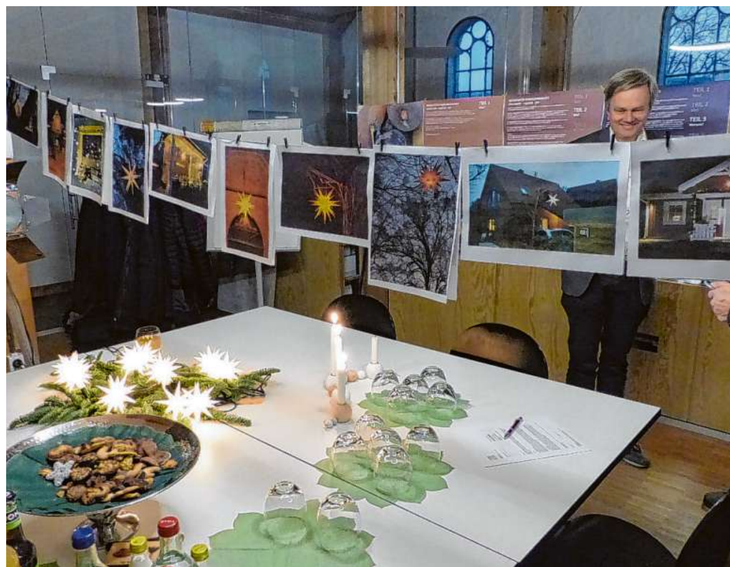
Ein kleines Panorama eingesandter Sterne war bei den Initiatoren eingegangen

Ordentlich Sternenglanz versprüht. Gewinner der Auslosung freuen sich über Preise