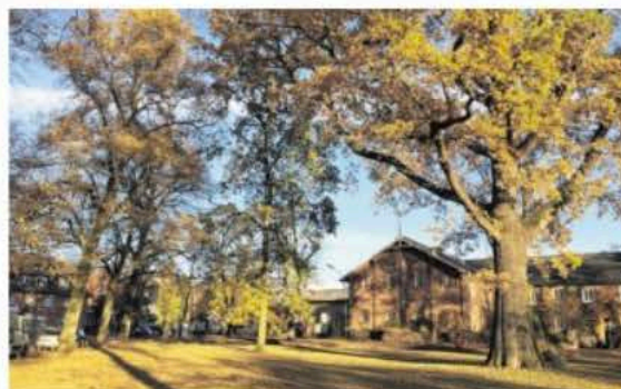
Idylle pur! Doch die Interessengemeinschaft Bergstedt möchte den Stadtteil Wasser als Einkaufsort wieder attraktiver machen.

Wer einen solchen Stern bei sich aufhängt und ein Foto davon an die IG Bergstedt mailt, hat die Chance, einen von drei Über-